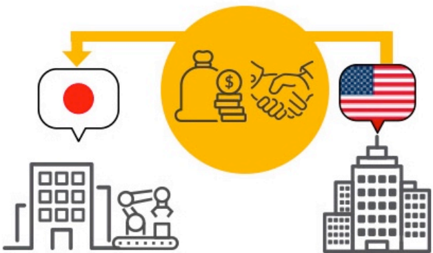
日本側の証拠開示を支援して和解

日本の大手製造メーカーが保有している特許を侵害しているということで、米国でこの会社の特許を侵害している企業を相手に米国の国際貿易委員会に輸入と販売の差し止め要求を出して提訴しました。